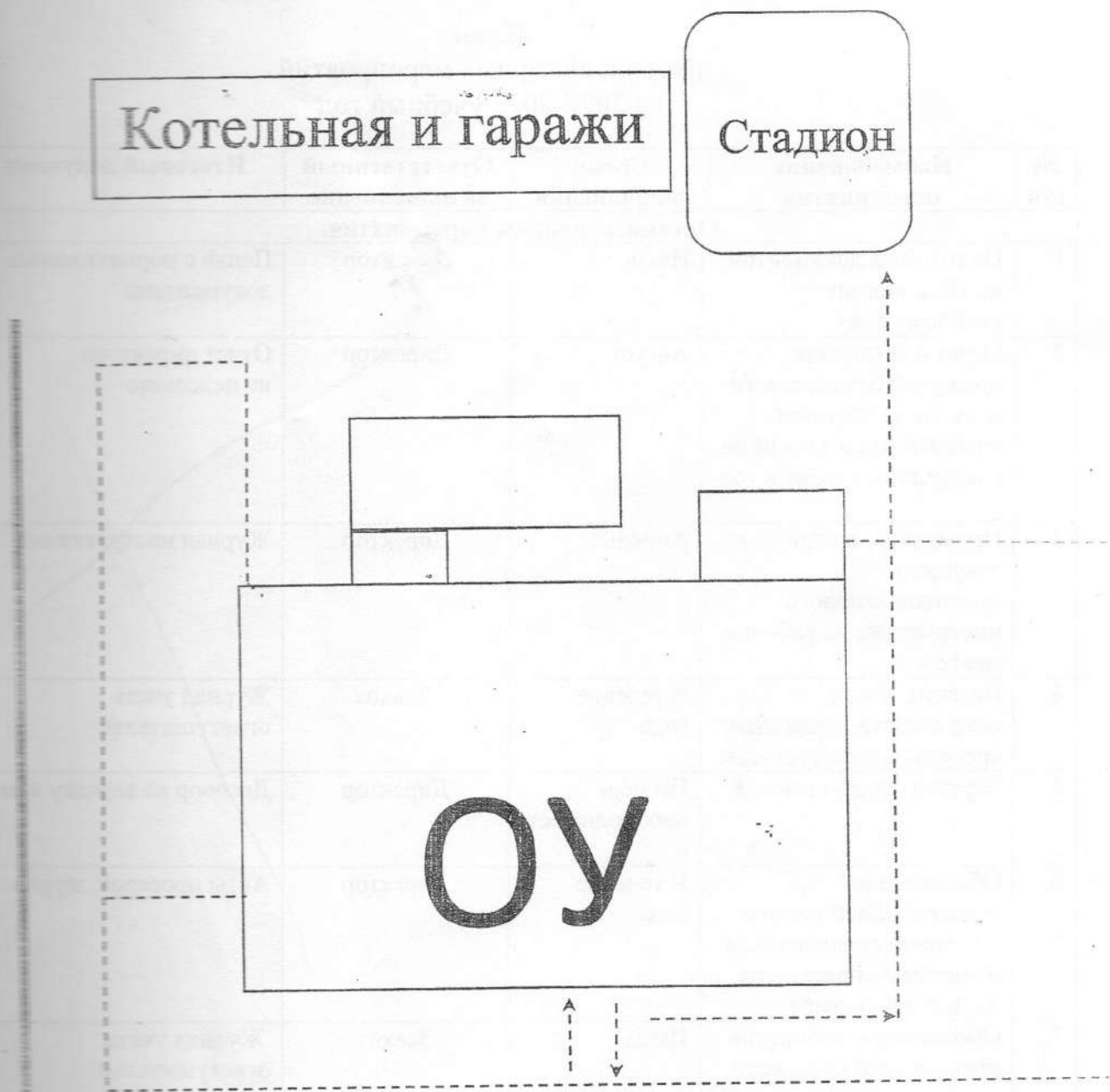
Схема организации дорожного движения в непосредственной близости от образовательного учреждения с размещением соответствующих технических средств, маршруты движения детей и расположения парковочных мест

-----> Движение детей и подростков на территории ОУ