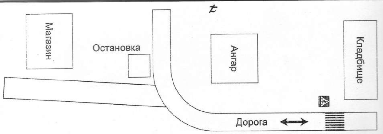
Схема организации дорожного движения в перекрестке пешей близости от образовательного учреждения в соответствии с соответствующими техническими средствами, маршруты движения детей и расположения парковочных мест