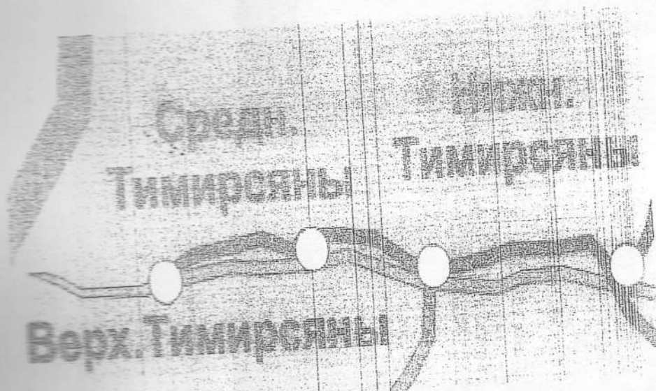
Схема маршрута (общий вид на картографической основе)